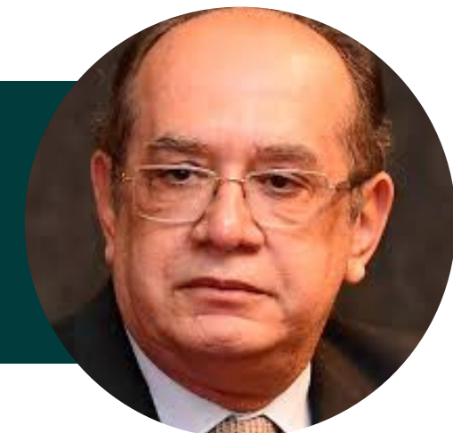
MIN. GILMAR MENDES (MINISTRO DO STF; INSTITUTO BRASILIENSE DE DIREITO PÚBLICO)

11, 12 E 13 DE NOVEMBRO DE 2020 - [ONLINE]