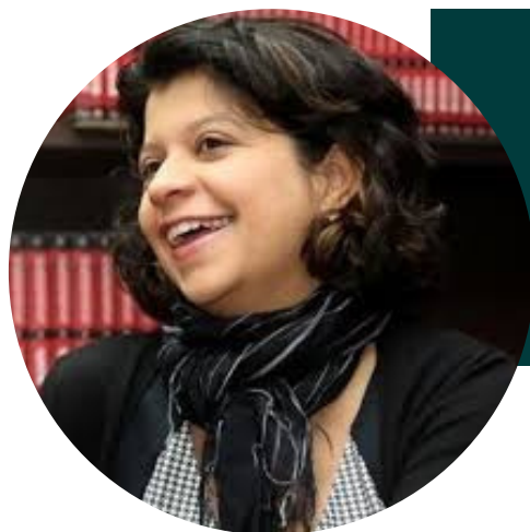
PROF.ª DR.ª FLAVIANE DE MAGALHÃES BARROS (UFMG)

11, 12 E 13 DE NOVEMBRO DE 2020 - [ONLINE]